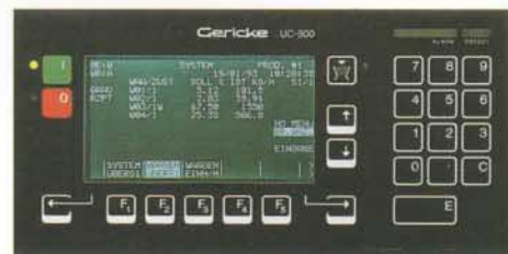
Beispiel: Systemsteuerung für 4 Dosierwaagen