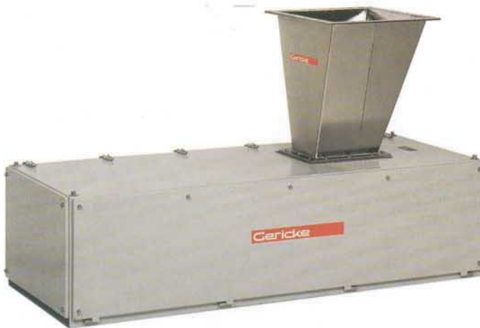
Dosierbandwaage im geschlossenen Zustand.

Die Bandwaage wird mit den der Funktion entsprechenden Bauteilen ausgerüstet, mit den nötigen Überwachungssensoren, Bandreinigern, als Option-Einlaufverwiegung usw.